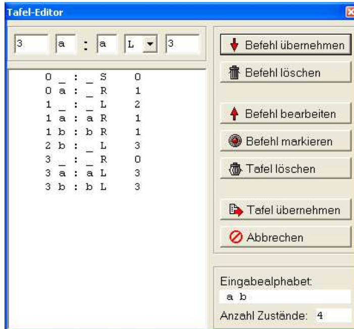
Abbildung 2: Der Tafel-Editor

Über den Tafel-Editor wird das Turing-Programm eingegeben. Die Eingabe der einzelnen Befehle erfolgt im oberen Bereich, und zwar in der Reihenfolge