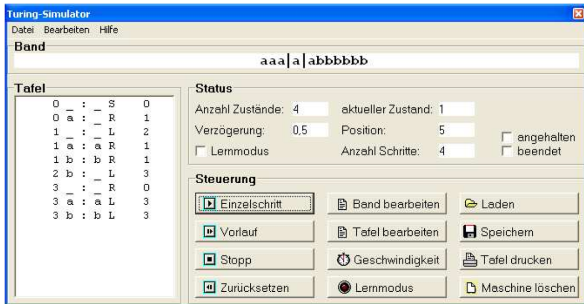
Abbildung 1: Das Hauptfenster